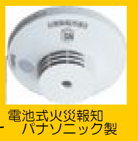
電池式火災報知機 パナソニック製

※大丈夫? 火の用心?? 火災報知機の設置が義務化されています ☆全メーカー取扱 ☆施工は短時間で可能です