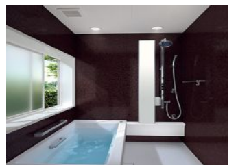
資料映像 TOTO スプリノ