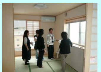
和室の見学。 建具・収納が注目的