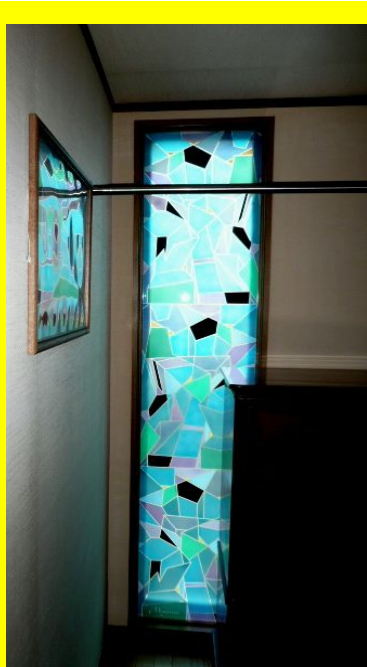
ウォークインクローゼットの 明り取り。 ホームページでカラーの画像を ご覧いただけます。

お問い合わせは ワーカーズコープLLP Tel.06-6535-7900 Email: info@wks-llp.net 細川まで