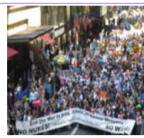
昨年5月、ニューヨークでの平和行進。NPT開催に力を発揮した

筆者も1978年の第1回国連軍縮総会に参加しましたが、国民の力はすごいものです。