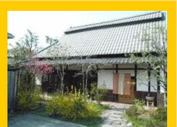
工事完了 風通し、日当たり最高!