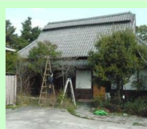
工事前 立派な枝振りですが...