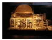
安全性も問題！ 「もんじゅ」PR館の展示

原発の立地条件や放射能の制御技術などを考えると、「そこまでして儲けたいか！」と思います。もっと安全性と環境を考えてほしいものです。