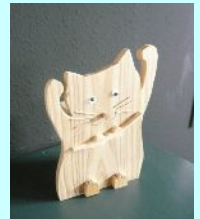
まけないぞ キャット

ウサギ・クマなど数種類。その他、本棚やプリンターなどもあります。各地で販売し、収益を東日本大震災の復興支援に寄付します。是非ご協力下さい。