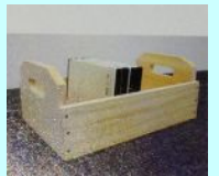
製作参考映像 竹中木工道具館提供

ウサギ・クマなど数種類。その他、本棚やプランターなどもあります。各地で販売し、収益を東日本大震災の復興支援に寄付します。是非ご協力下さい。